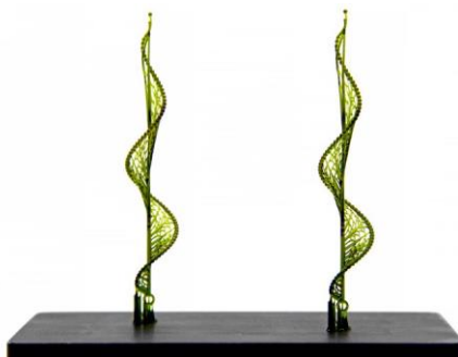
PIC 100 Green Fondibile